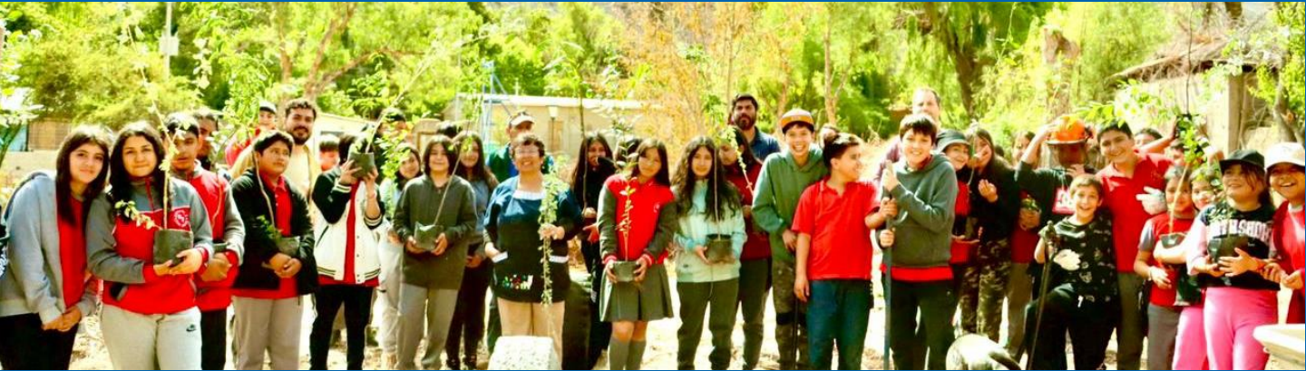
Vinculación multisectorial con CONAF