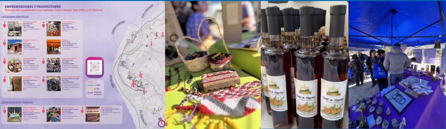
Iniciativas comunitarias del PGS PPL: difusión emprendedores del sistema de localidades