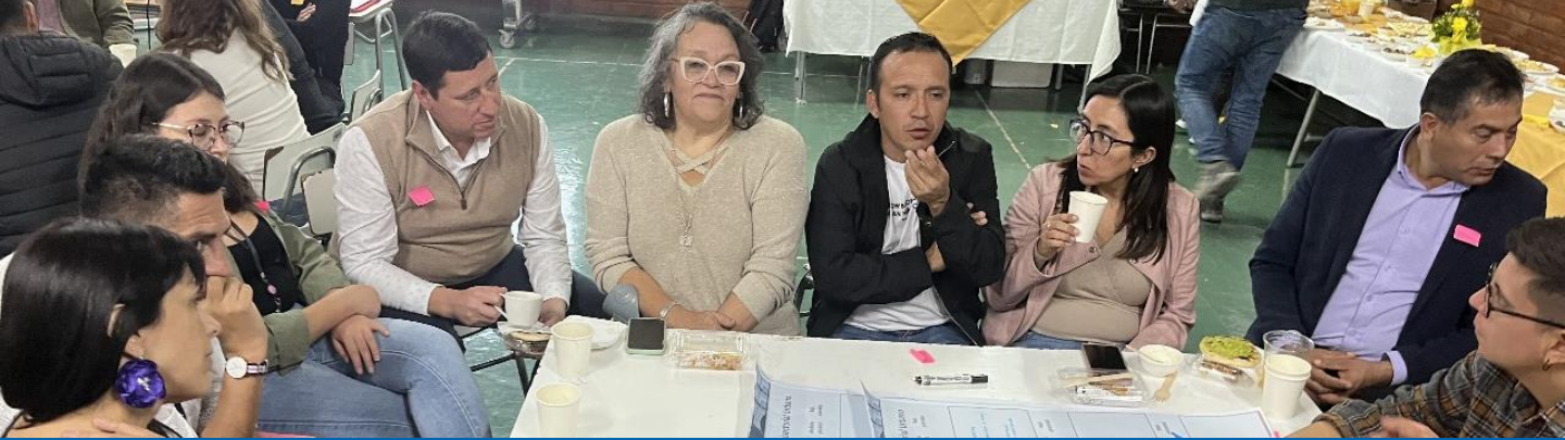
Hito: presentación plan de desarrollo local