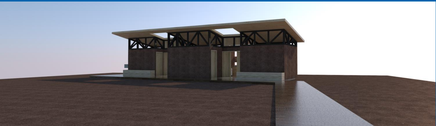
Proyecciones 2024: diseño SS.HH en espacio público