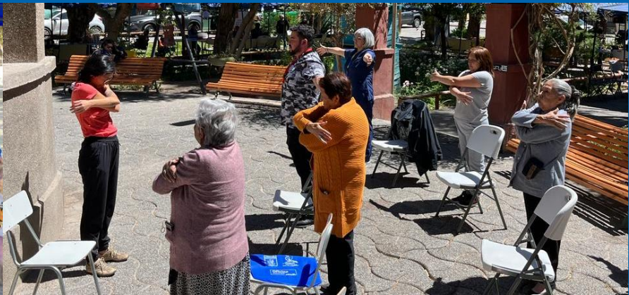
Multisectorial comunitario: feria de cuidados - Programa red local de apoyo y cuidado