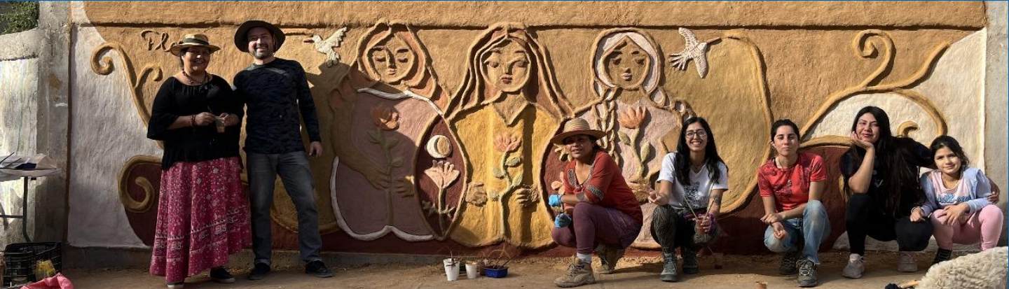
Multisectorial social: apoyo FNDR glosa seguridad: prevención de violencia hacia la mujer