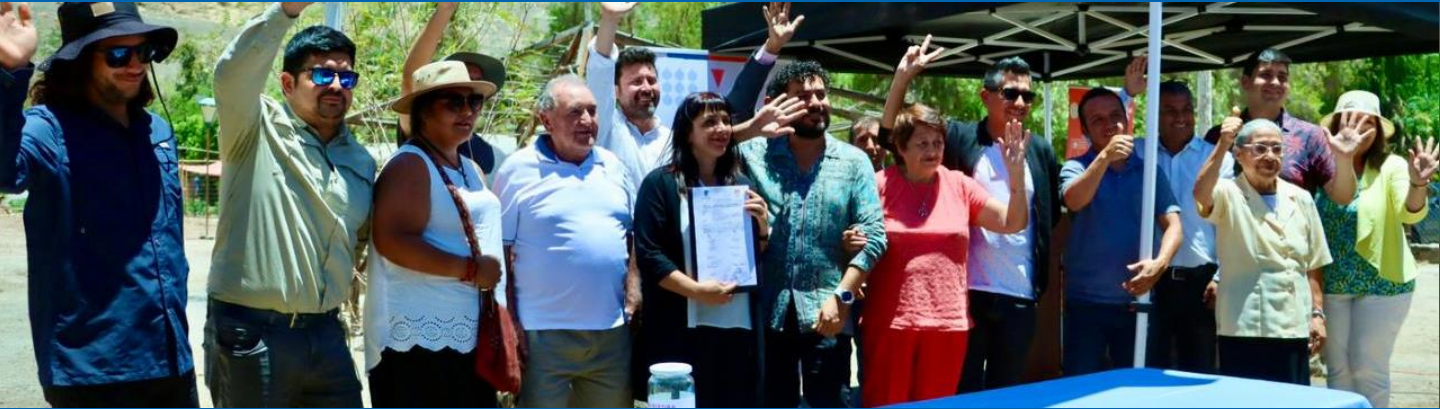
Hito primera piedra obra detonante: conservación ex camping de San Félix