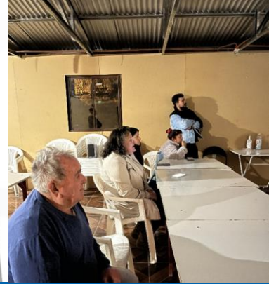
Participación diseño paradero los canales