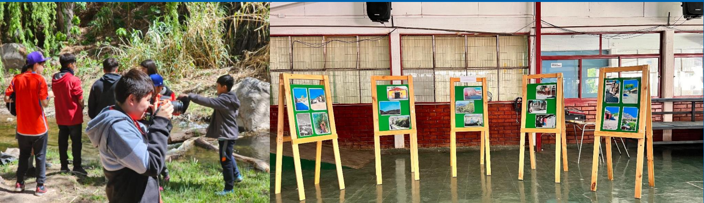
Iniciativas de patrimonio recorrido fotográfico patrimonial