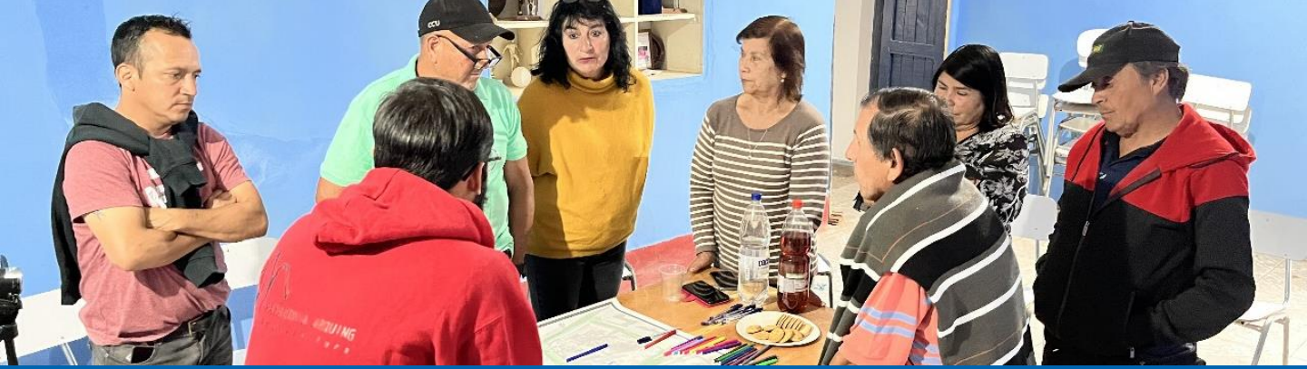
Apoyo difusión diseño participativo plaza de San Félix